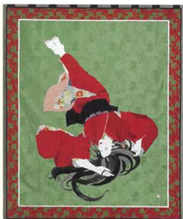
「フリースペース」 2007年