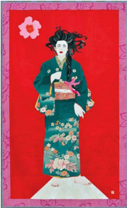
そして、ここから前 185×114cm 2014年「メッセージシリーズ」 〈最新作〉

■3月14日(金)~21日(金・祝)午前10時~午後5時 ■西武筑波店 6階=つくば西武ホール