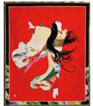
リスト 愛の夢 第3番 194×161cm 2000年 「クラシックシリーズ」