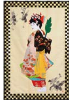
菊づくし 172×117cm 2010年 「日本舞踊シリーズ」