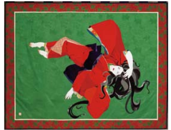
フリースペースII 143×183cm 2008年 「メッセージシリーズ」