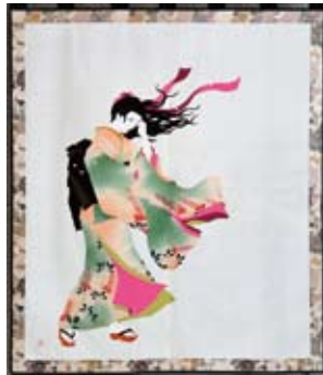
アデレードへの思案 180×153cm 2002年 「国際交流シリーズ」