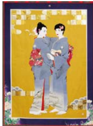
プロローグ 198×147cm 2007年 「メッセージシリーズ」