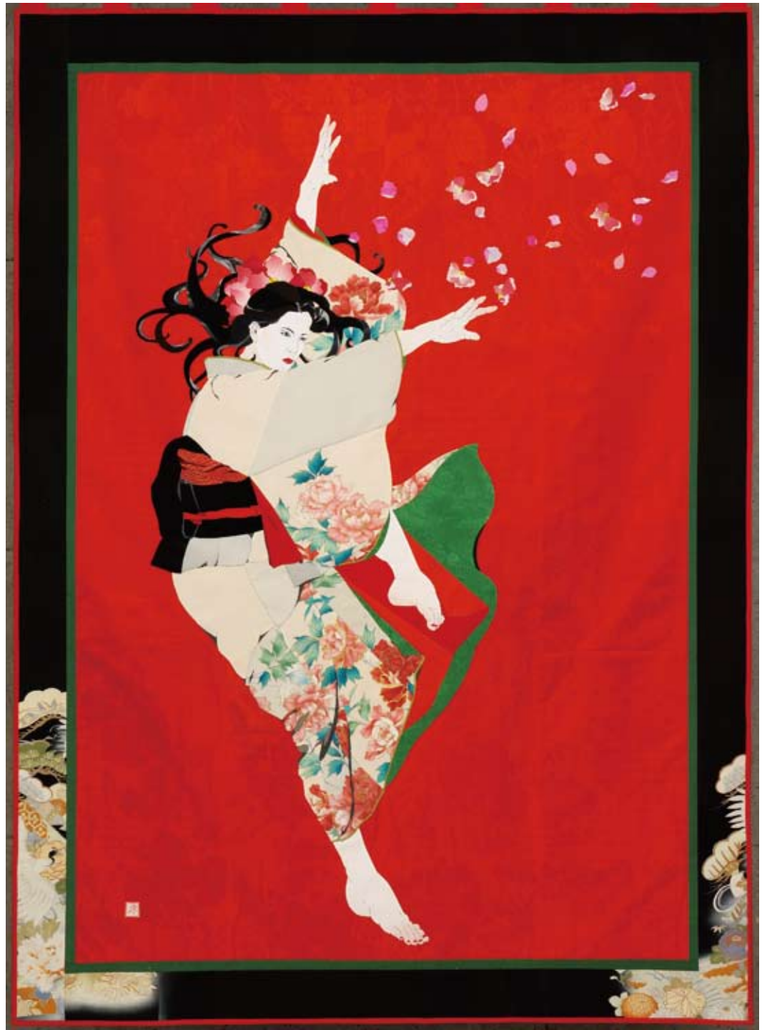
M氏に捧げる踊り 194×142cm 2007年「メッセージシリーズ」

日本の古布で描く布絵(NUNO-E)。懐かしくて新しい。貴方もきっと感動します。